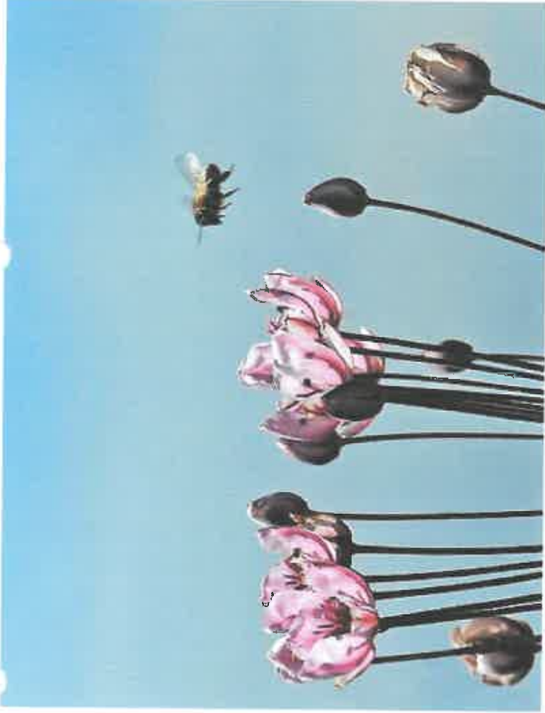
Schwanenblume mit Besucher im Anflug

Das Freizeitgelände liegt idyllisch an zwei Teichen. Es lohnt sich, einmal die dortigen Pflanzen und Tiere zu betrachten. Wer sich still verhält, kann allerlei Beobachtungen machen. Bienen und Schwebfliegen bevölkern die Blüten einer Schwanenblume, ein Teichhuhnpärchen und ein Schwanenpaar haben Junge, eine Stockente hat in einer Kopfweide gebrütet und verschiedene Libellenarten kann man mit dem Makroobjektiv fotografieren.